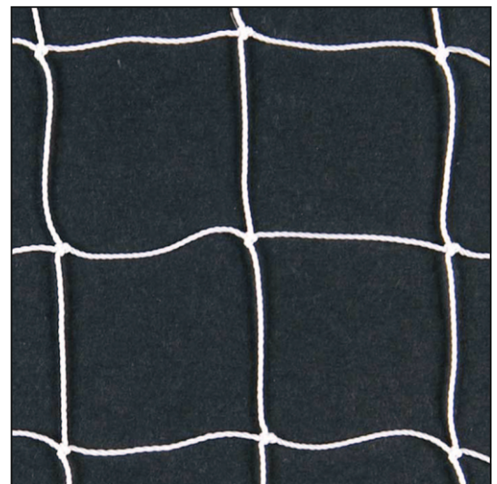
weiß / blanc / white