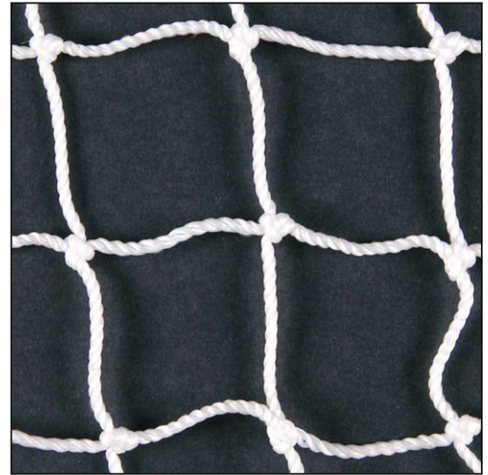
weiß / blanc / white