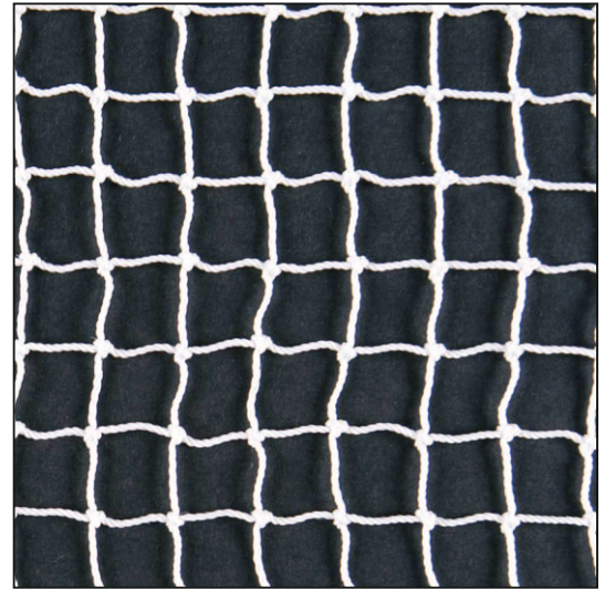
weiø / blanc / white

Alle Bÿhnennetze und Gazennetze sind appetiert, gespannt und quadratisch gesetzt. Andere Grøøen, Maschenweiten, Sonderfarben auf Anfrage. Tous les ■lets de sc»ne sont traités et tendus au carré. Autres dimensions, mailles et coloris sur demande. All stage nets are knotted into squares which retain their shape when hung. Other dimensions, square sizes or colours on request.