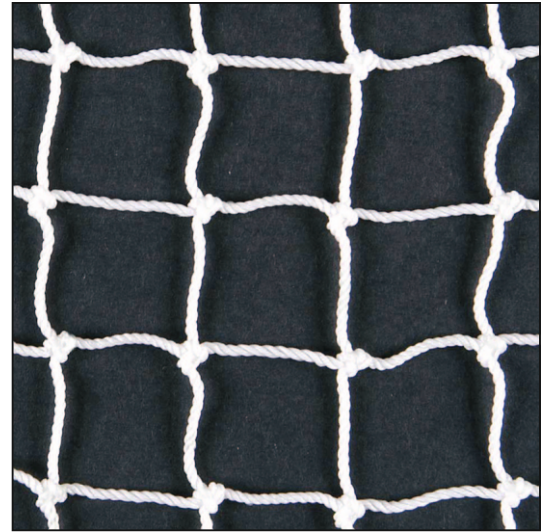
weiß / blanc / white